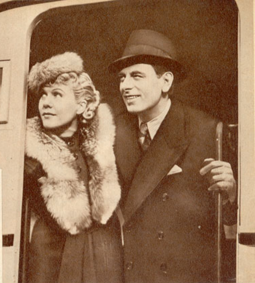
HILDE KRÜGER, PAUL HORBIGER, FITA BENKHOFF, JOHANNES RIEMANN und THEO LINGEN in der Ehemödie „Drunter und drüber“