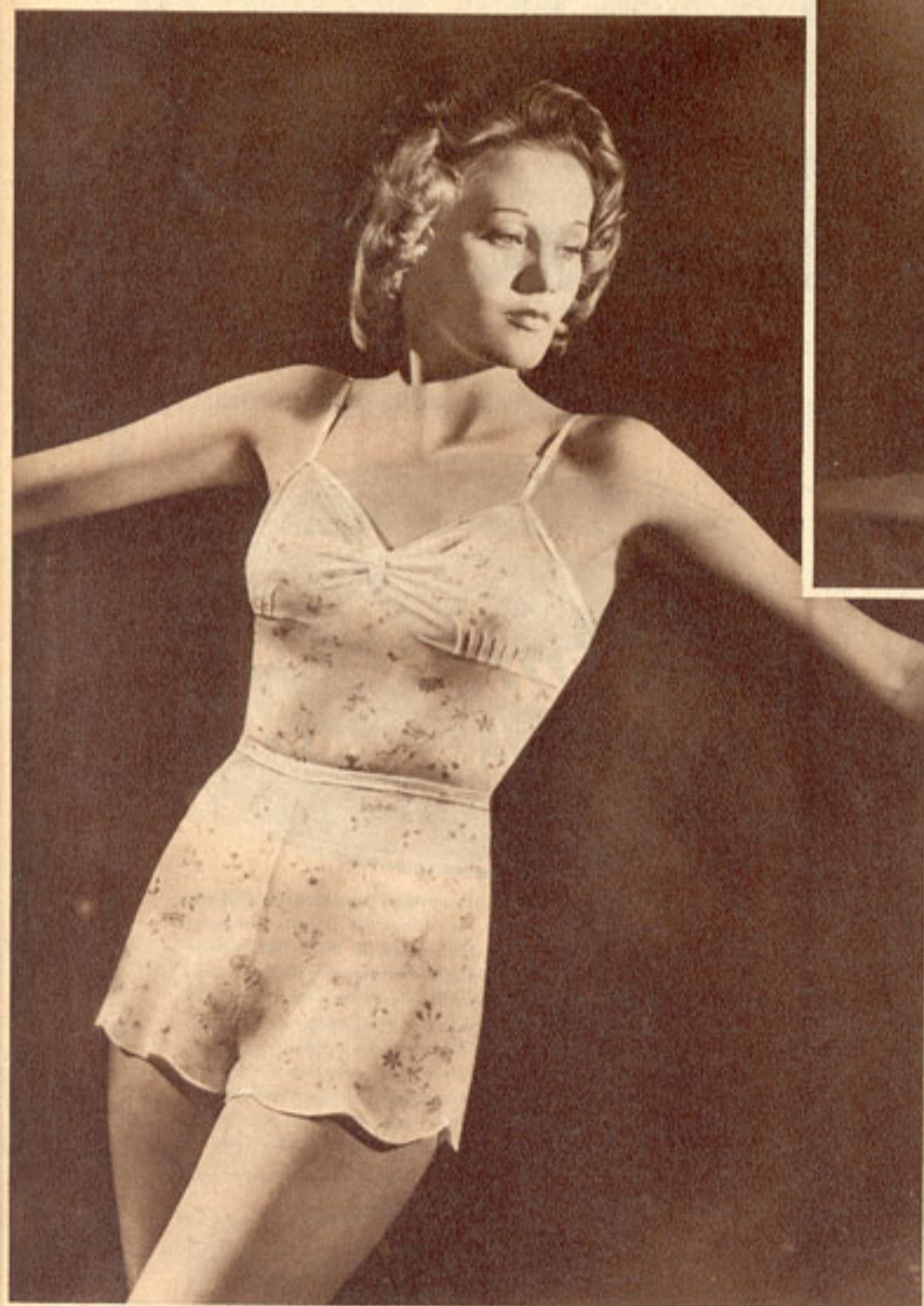
Spitzen und Seide, fröhlich geblümt

Modelle: Stelzmann und Venus