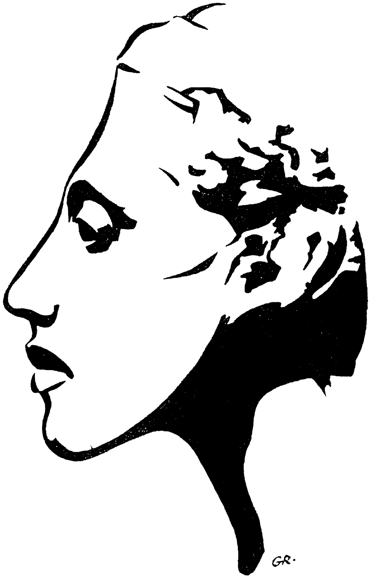
Kopf des Pharaonen Amenophis IV. (um 1370 v. d. Zeitw.)

rassischen Spannungen innerhalb der ägyptischen Dynastien