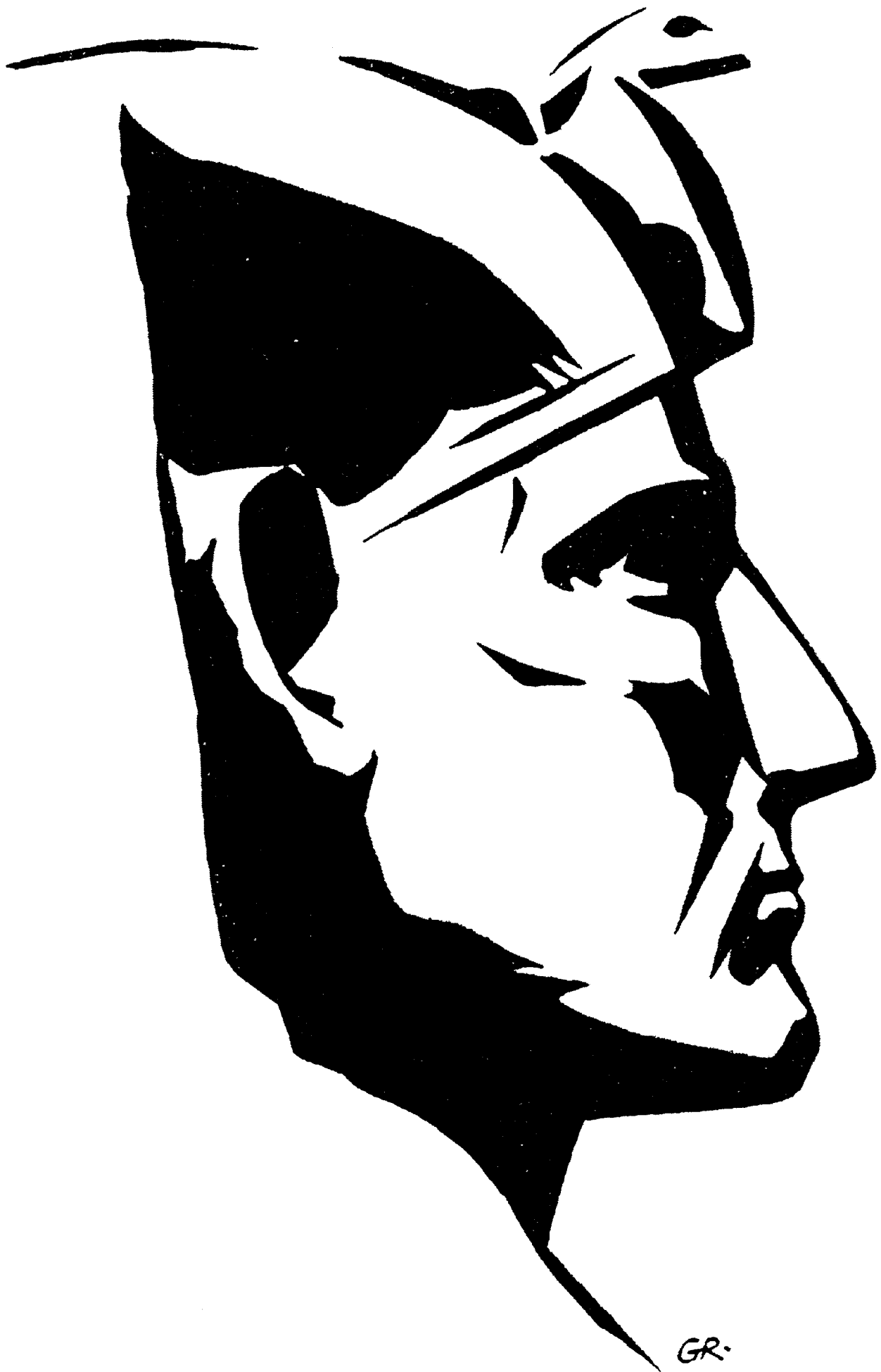
Kopf des Pharaonen Amenemhet III. (um 1820 v. d. Zeitw.)

Der Vergleich der beiden Köpfe zeigt in anschaulicher Eindringlichkeit die